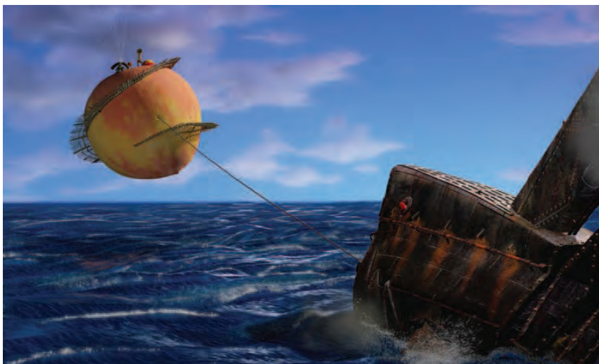
Рис. 1.3 Сцена из фильма «Джеймс и гигантский персик»

Вот пример, с которым мы будем работать, – это сцена из фильма «Джеймс и гигантский персик», показанная на рис. 1.3.