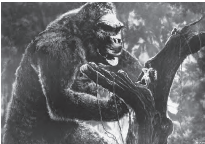
Рис. 1.2 Ранний композитинг из фильма «Кинг-Конг» (King Kong © 1933 Turner Entertainment Co.)