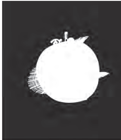
Рис. 1.5 Извлеченная маска персика

такой элемент: особое изображение, называемое маской (matte), которое было получено из персика на зеленом экране, чтобы впоследствии его можно было добавить в сцену.