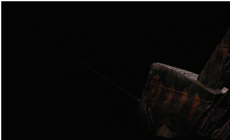
Рис. 1.4б Гигантская механическая акула