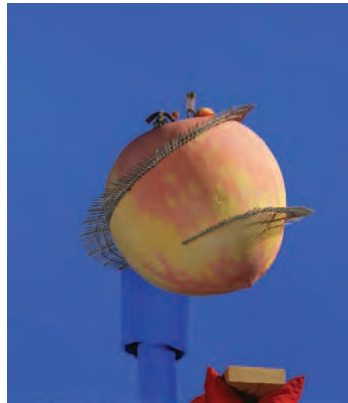
Рис. 1.4а Миниатюра гигантского персика на синем экране