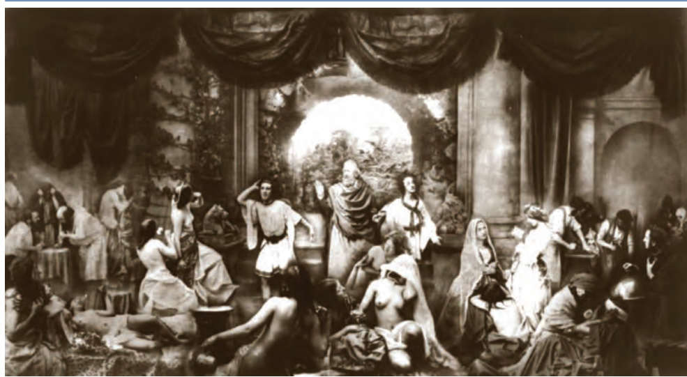
Рис. 1.1 Ранний композ фотографа Оскара Густава Рейландера, « The Two Ways of Life »

людей в нужной ему манере. Совершенно точно это был бы дорогой и долгий процесс. Вместо этого он снимал малые группы людей и небольшие локации, корректировал положение каждого элемента и изменял размеры так, как ему было угодно. В некоторых случаях единственным способом сделать их достаточно маленькими была съемка отражения в зеркале. Как только было сделано несколько негативов, процесс комбинирования включал в себя лишь выборочную печать на бумаге и проявку негатива в нужной области.